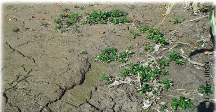
Développement de Jussies sur vase de curage