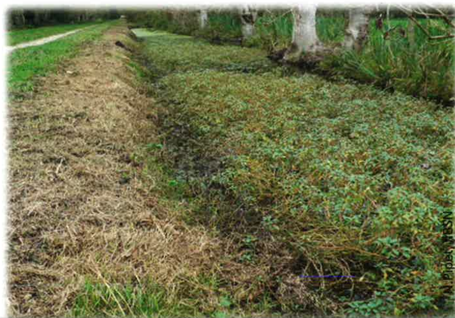
Jussies en fossé (Marais poitevin) : broyage des plantes de berge et des Jussies