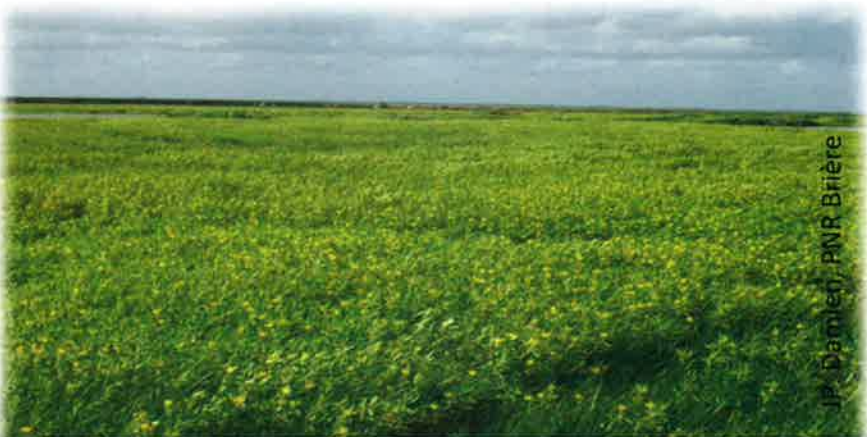
Prairie humide envahie de Jussies (Brière)